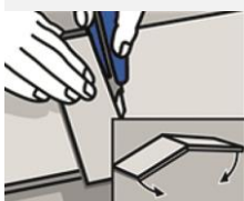
Insnijden en afbreken op de snijlijn.

Uitsparingen kunnen eenvoudig met een gatenzaag of decoupeerzaag gemaakt worden. Zaag de uitsparing altijd ruim uit, minimaal 2-3 mm speling. Nadien de voeg dichtkitten.